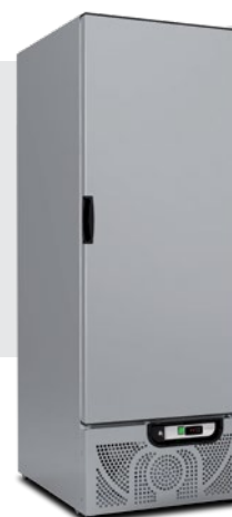
CHEF 600 PX

✓ Respect de l'environnement : Gas R600a Respeto del medio ambiente: Gas R600a