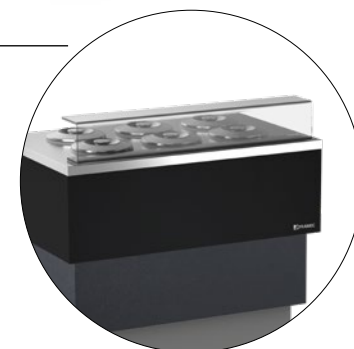
Étagère de service en plexiglas Protector con superficie para servir en plexiglas