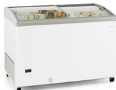
SILE 300 GTC