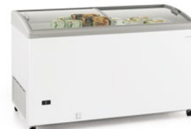
SILE 500 GTC