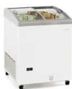
SILE 170 GTC