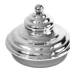
Couvercle pyramidal Tapa piramidal

Carapine non fornite Cylindrical tubs not included