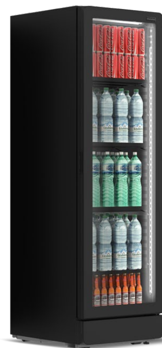
ACQUA PLUS P 400 B