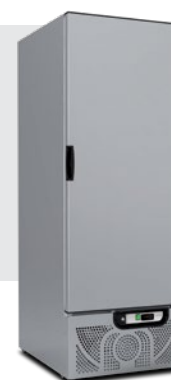
CHEF 600 NX