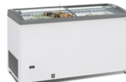
SILE 500 GTC