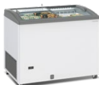
SILE 300 GTC