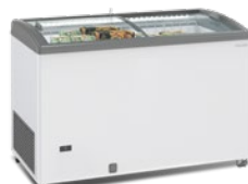
SILE 400 GTC