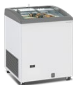
SILE 170 GTC

✓ Respect de l'environnement : Gas R600a Respeto del medio ambiente: Gas R600a